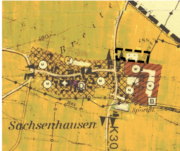
Auszug aus wirksamen Flächennutzungsplan vom 18.03.1993

Gemarkung Sachsenhausen Erweiterung Wohnbauflächen im Bereich des Bebauungsplans „Bachtalblick“ unmaßstäblich