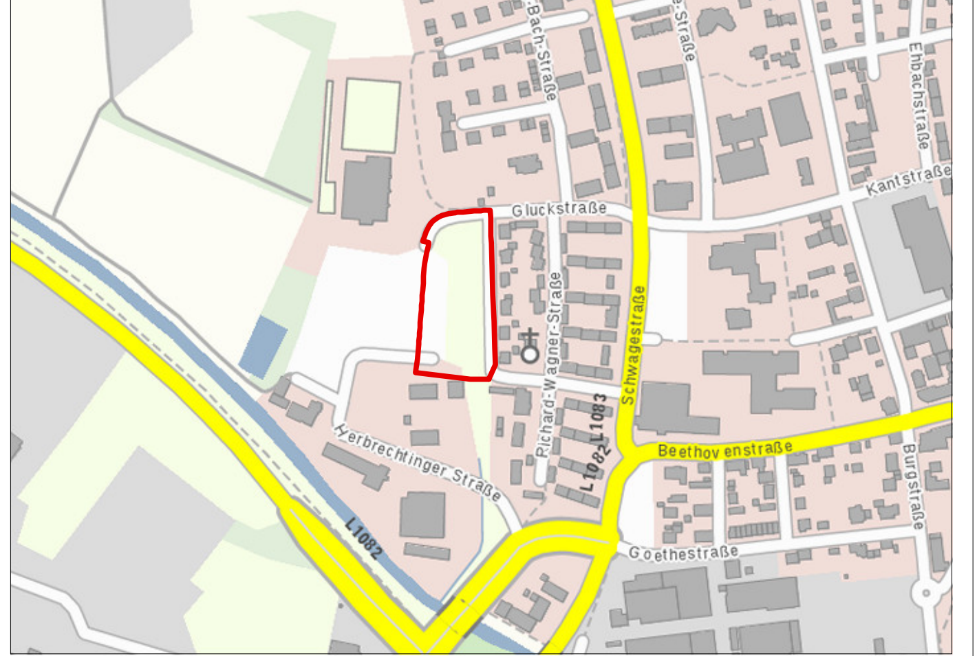
M 1 : 25.000