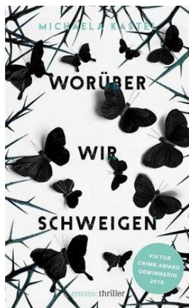
Worüber wir schweigen von Michaela Kastel