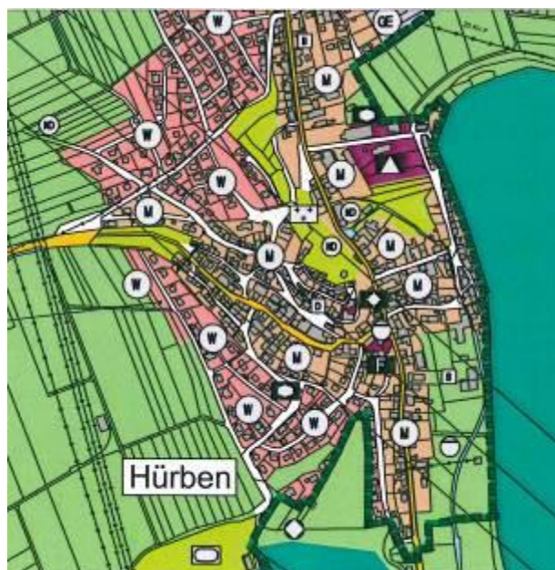
2. FNP-Änderung „Westliches Bühlfeld - Teil I“ - 2009

Stand 2. FNP-Änderung „Westliches Bühlfeld - Teil I“ - 2009, Karte stellt digitalisierten FNP von 1993 dar