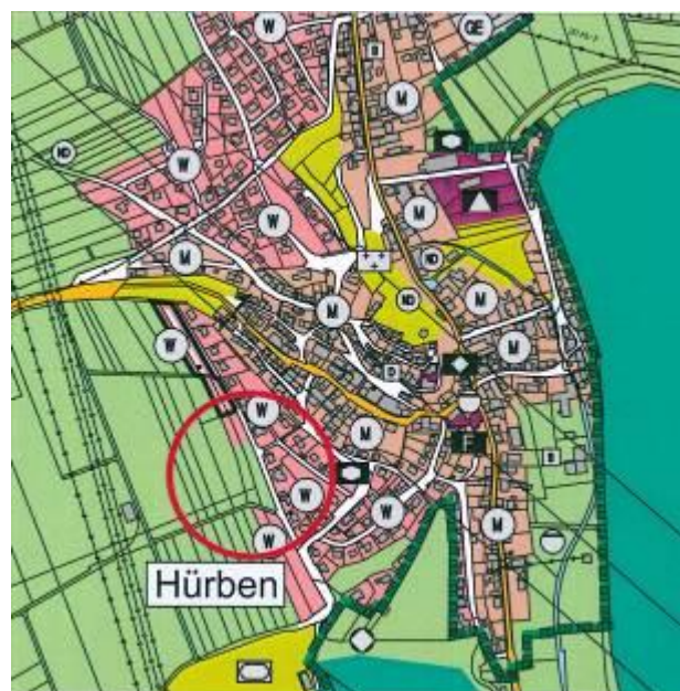
FNP nach Berichtigung „Westliches Bühlfeld - Teil II“