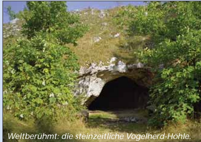
Weltberühmt: die steinzeitliche Vogelherd-Höhle.

Von Lindenau zur "Bocksteinhöhle" ⑧ sind es knapp 3 km, dabei wandern wir den selben Weg, den wir vom Tal gekommen sind. Nach Überquerung des Tals geht es links Lone (bei Trockenheit wasserlos) aufwärts bis wir den Wanderparkplatz an der Straße Stetten-Bissingen erreicht haben. Wir biegen nun links auf eine Asphaltstraße ein, auf der wir nach ca. 200m links abbiegen, um nach einem Anstieg die Bocksteinhöhle zu erreichen.