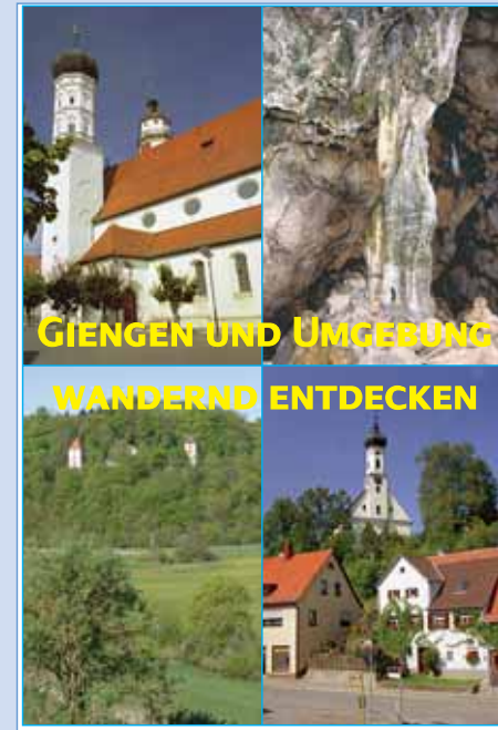
GIENGEN UND UMGEBUNG