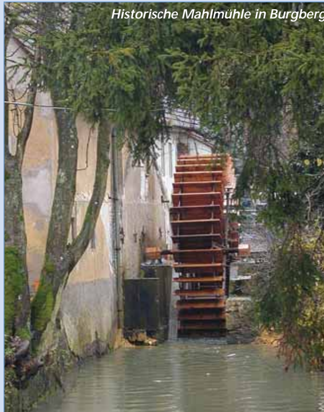
Historische Mahlmühle in Burgberg.