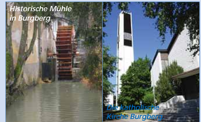
Die katholische Kirche Burgberg.