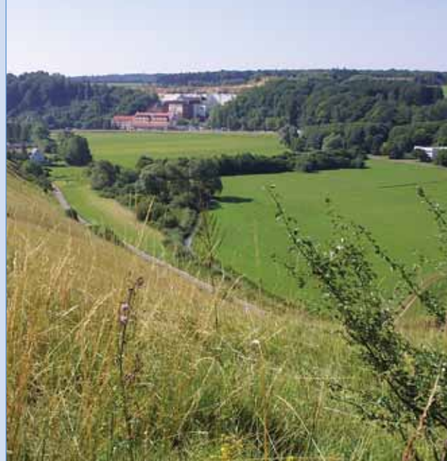
Das Hürbetal mit Fa. Omya (Hintergrund), LW-Pumpwerk (rechts) und dem ehemaligen Damm des "Hinteren Sees" (Bildmitte), der sich bis zum Fuße der Kaltenburg erstreckte.