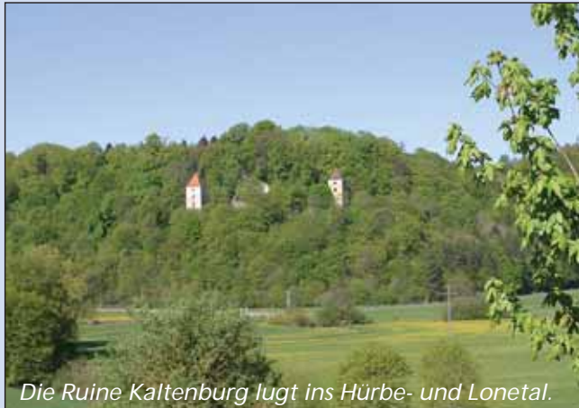
Die Ruine Kaltenburg lugt ins Hürbe- und Lonetal.

Wir steigen den Hügel abwärts bis zur Straßenkreuzung,