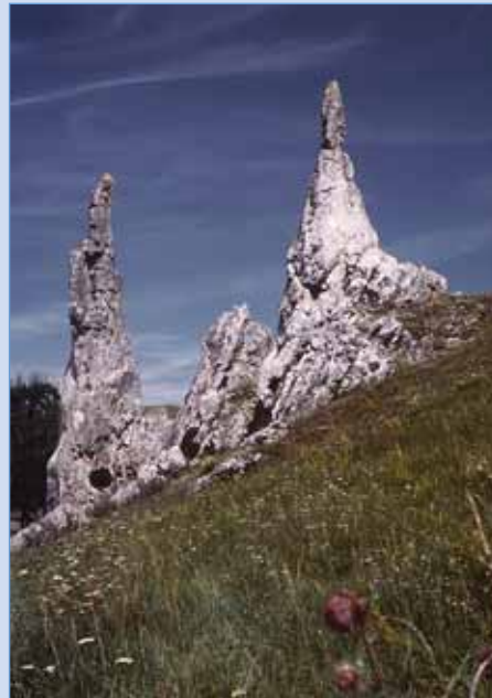
Das Wahrzeichen des Eselsburger Tals: Die Steinernen Jungfrauen.