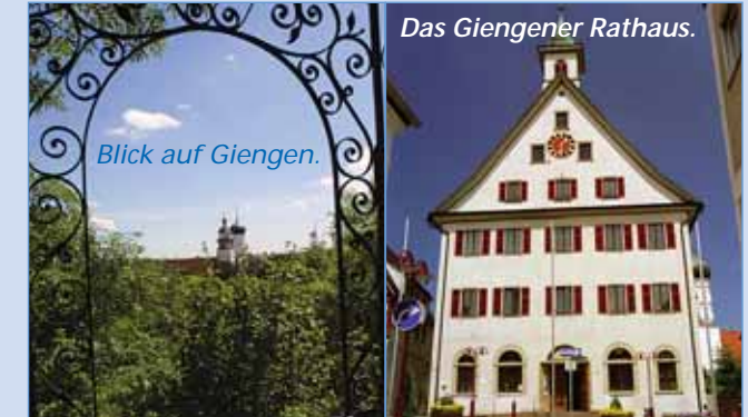
Das Giengener Rathaus.