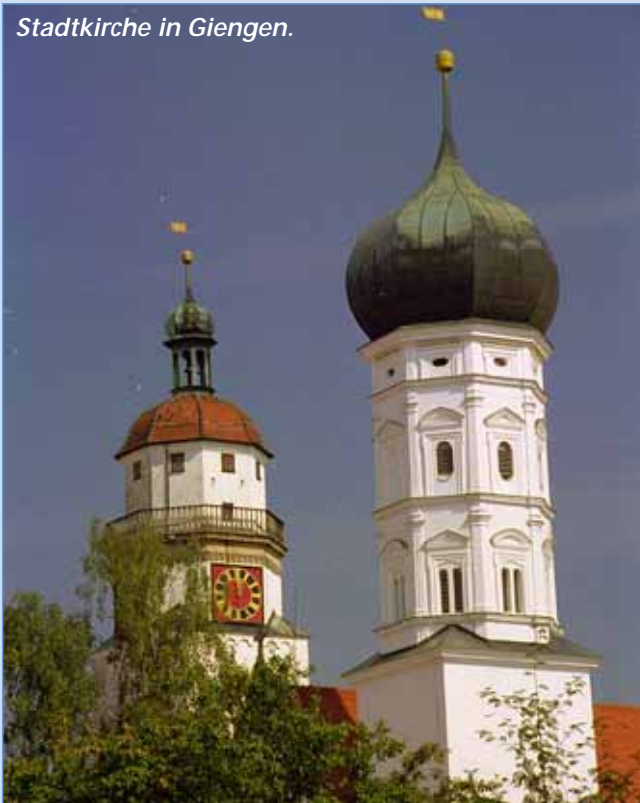
Stadtkirche in Giengen.