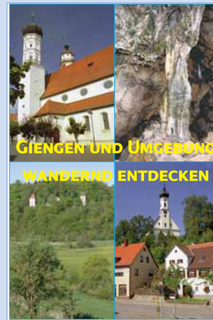
GIENGEN UND UMGEBUNG