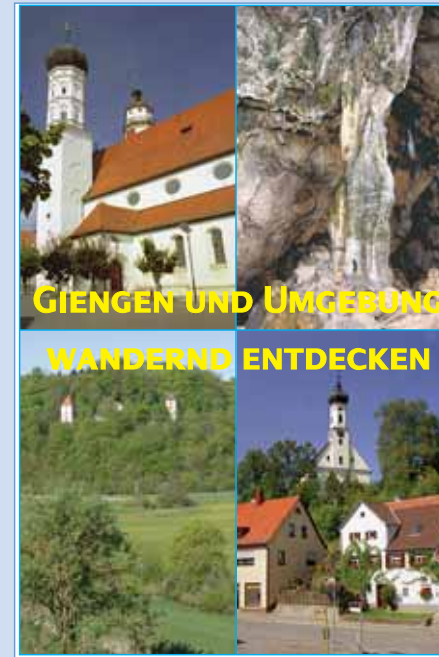
GIENGEN UND UMGEBUNG