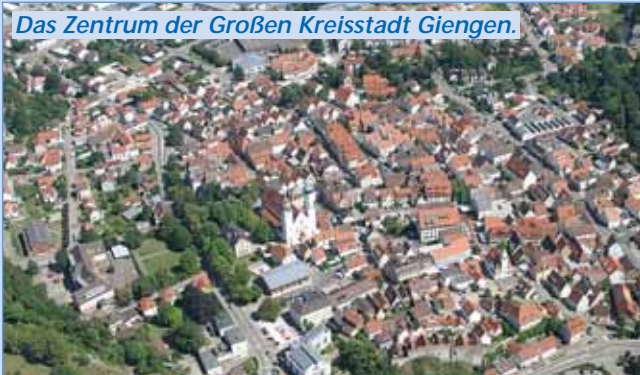
Das Zentrum der Großen Kreisstadt Giengen.