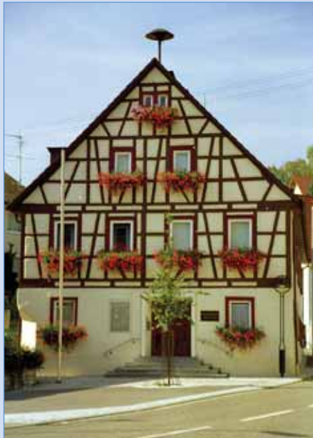
Das Stadtmuseum Giengen-Hürben in der Mitte Hürbens.