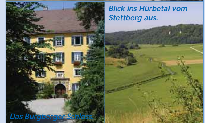
Das Burgberger Schloss.