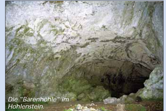
Die "Bärenhöhle" im Hohlenstein.

Als kürzere Alternative - etwa 9 km - bietet sich der Start beim Wanderparkplatz Lonetal ⑩ an der Straße Bissingen-Stetten an, den Sie bequem mit dem Auto auf der Kreisstraße durch den Weiler Lontal erreichen. Vergessen Sie aber nicht, der nahen Vogelherdhöhle unbedingt einen Besuch abzustatten, bevor Sie talaufwärts die weiteren Wanderziele angehen.