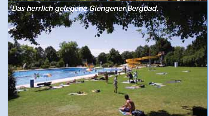
Das herrlich gelegene Giengener Bergbad.